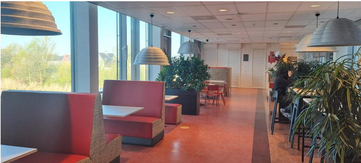
Prostory školní jídelny