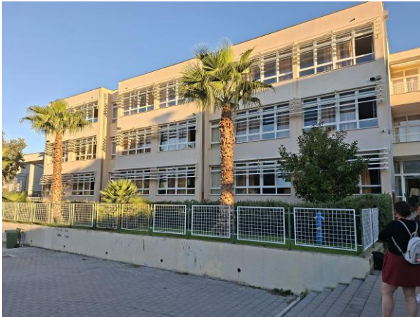
Obr. 1 – Hostující škola, společné foto s vedením školy