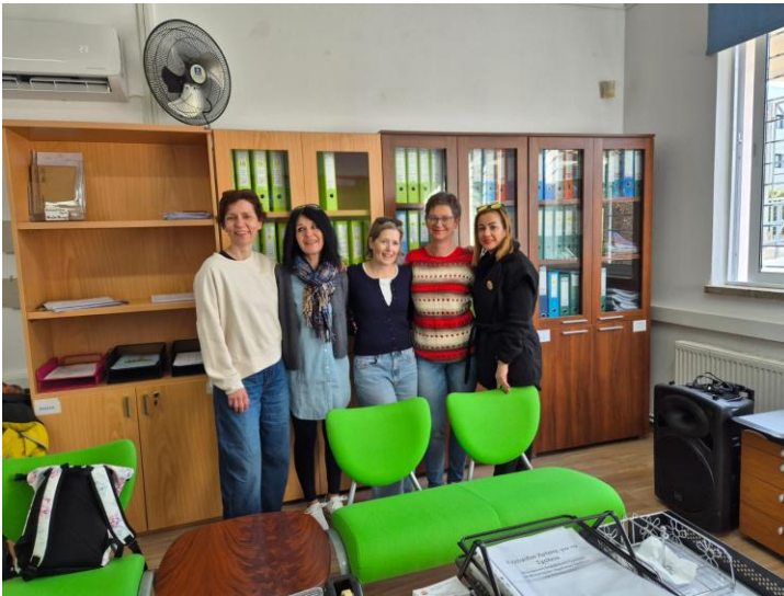
Foto s koordinátorkou